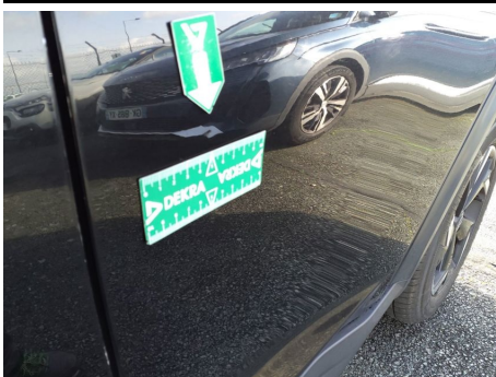
Porte Arrière Gauche