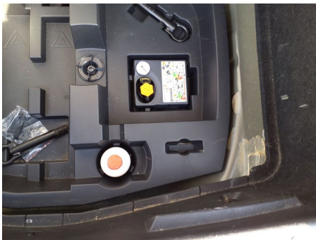
Roue de secours