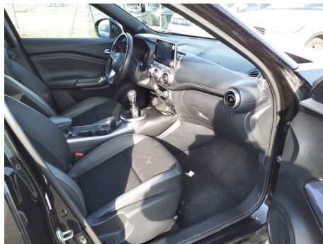
Compartment passager avant