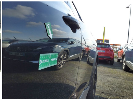
Porte Avant Gauche