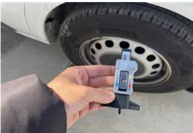
Vista Neumático Trasero Derecho