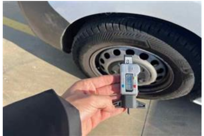
Vista Neumático Trasero Izquierdo