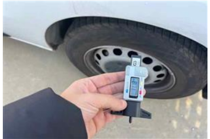
Vista Neumático Delantero Izquierdo