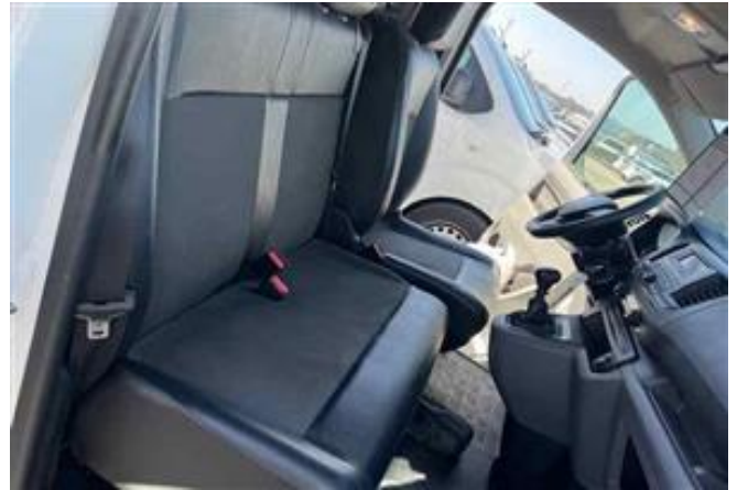
Vista Asientos traseros