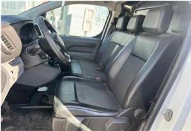
Vista Asientos delanteros