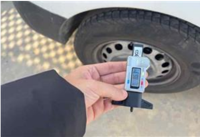
Vista Neumático Delantero Derecho