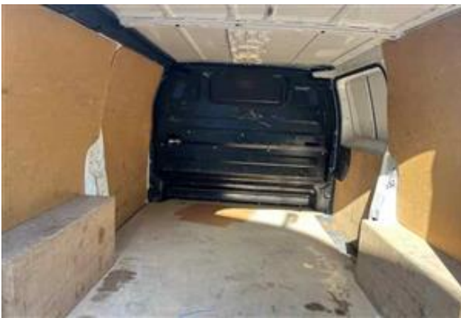
Vista Zona de carga