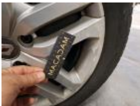
Deur V R sierlijst