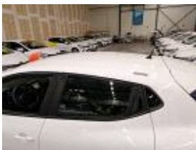
Deur A L